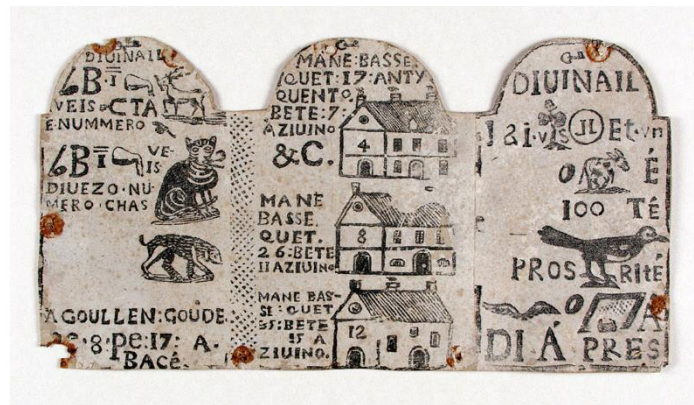
Rébus en breton conservé au Musée départemental breton de Quimper (R.1885.35.2.), don d'un particulier fin 19 e siècle

Définir un schéma breton des archives , concerté et partagé