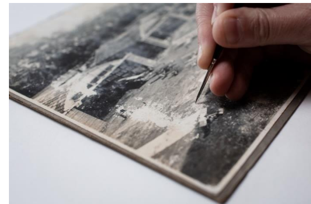
Travail de restauration sur une photographie par Gwenola Furic

La numérisation gratuite proposée par certaines sociétés (comme Google Arts & Culture) impose une réflexion commune