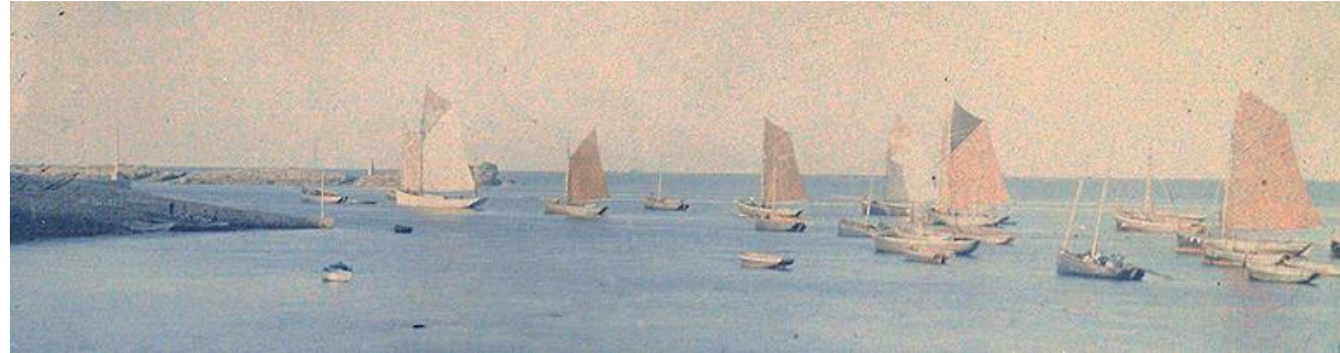
Bateaux au mouillage, probablement l'île de Sein, autochrome, vers 1910 (2002.0043.24)

La valorisation des archives fait l'objet de nombreuses initiatives (expositions, ouvrages, résidences d'artistes, datavisualisation). Leur mise à disposition sur les portails internet représentent un travail de traitement colossal mais nécessaire : documentation, indexation normalisée, numérisation, hébergement...