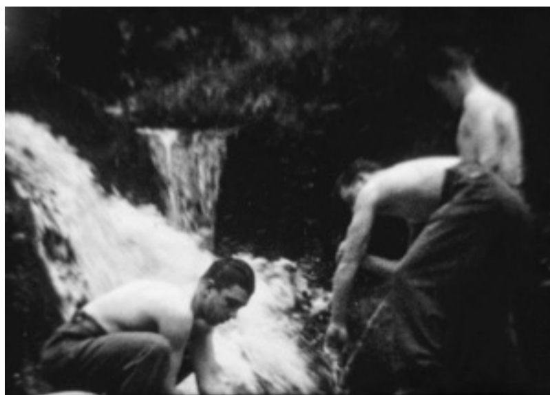
Photogramme issu du film Delattre de 1945

Un an auparavant, muni de l'appareil photo et de la caméra de son père, il photographiait la Libération de Guingamp le 7 août 1944. En août 1945, père et fils font reconstituer aux maquisards les combats de la Libération. Dans le bois de Coat-Mallouen les maquisards jouent leur propre rôle, d'autres celui des Allemands. La vie quotidienne - scènes de repas, de bains dans la cascade - y est évoquée ainsi qu'une reconstitution du désormais célèbre combat du 27 juillet 1944 où plus de 150 Allemands ont été anéantis par les maquisards.