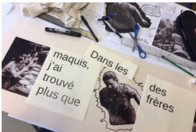
Détail d'une page du livre d'artiste réalisée par Sydney