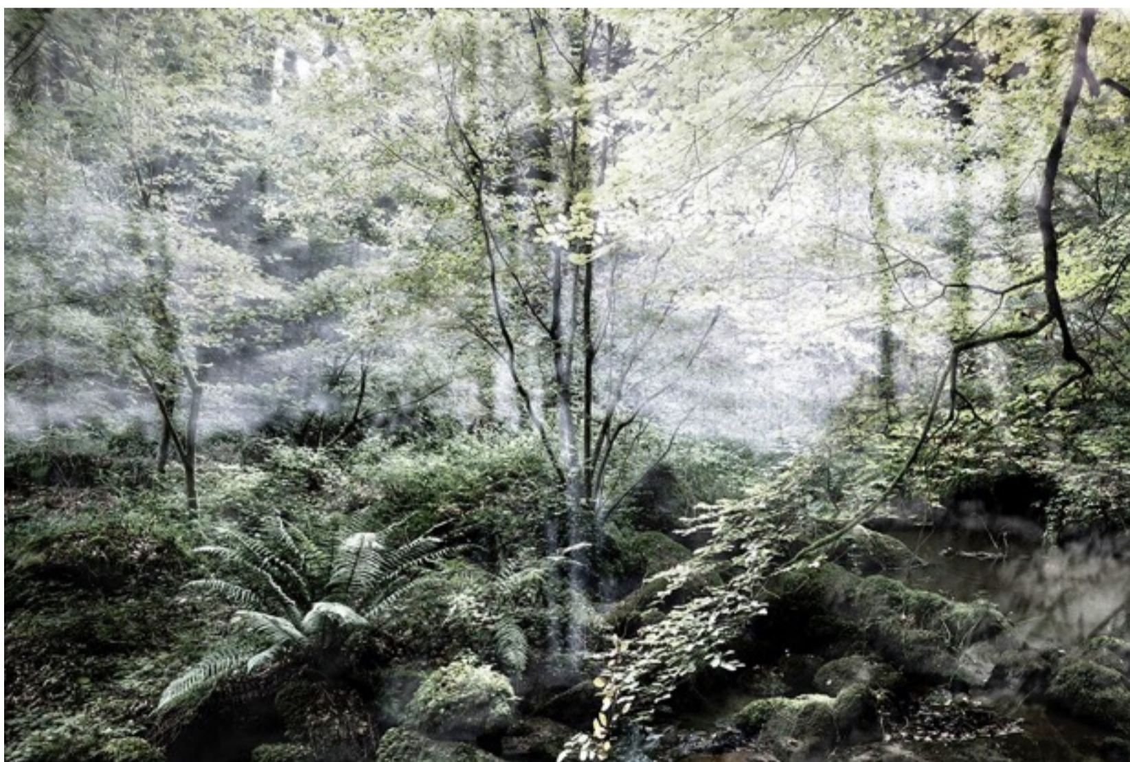
Photogramme issu du film Delattre , projeté sur photographie. Tirage sur papier japonais, format 60 X 90 cm.

A mi-chemin entre recherches documentaires et esthétiques, ce travail propose une interprétation plastique du lieu à partir de sa forêt et des archives Delattre. Par couches successives, dans des images mêlant prises de vues en forêt, photogrammes et projections, Sophie Zénon fabrique et scénographie un paysage mémoriel dans lequel les corps sont des spectres, porteurs d'enjeux historiques et politiques. De ses évocations puissantes naissent des archives poétiques d'une histoire contemporaine.