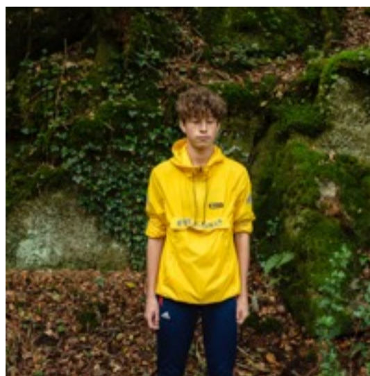
Portraits des élèves réalisés par Sophie Zénon dans le bois de Coat-Mallouen.