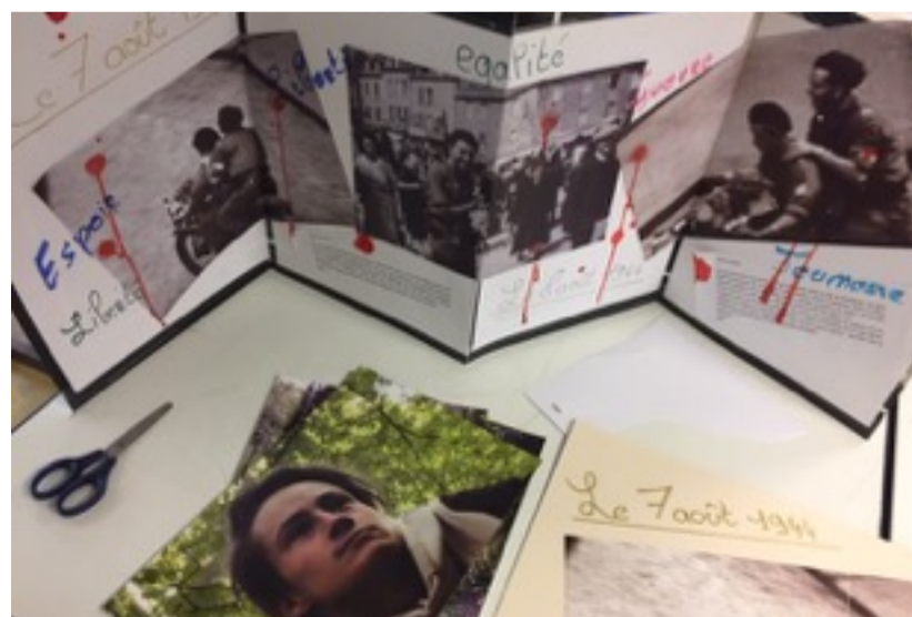
Détail d'une page du livre d'artiste réalisée par Julian