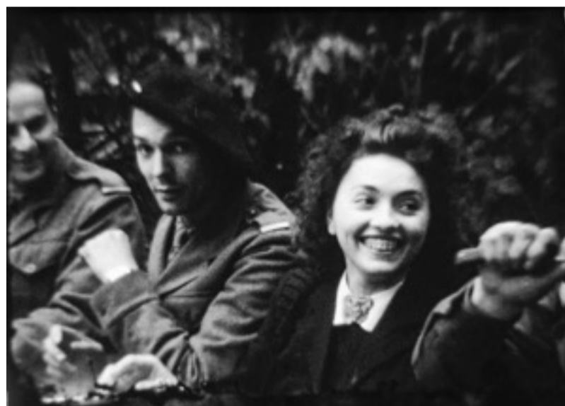
Photogramme issu du film Delattre de 1945

Les reconstitutions après-guerre ont été nombreuses, organisées majoritairement par des institutions ou des cadres militaires. Ce qui est unique ici, ce sont ces images tournées par des civils. Sur les visages se lisent une joie, un enthousiasme qui contrastent avec la réalité des conditions de vie dans le maquis vécues une année auparavant. Dans ces visages, on peut lire ce qui animera toute une génération : le désir d'une vie autre, un élan, un espoir. Un « mai 68 de la résistance ».